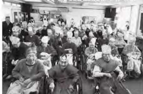
たくさん福が来ますように