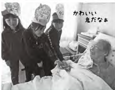
かわいい 鬼だなあ