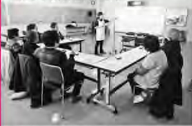
きめこみバッチワークを作りました。