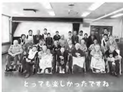
とっまも楽しかったですね