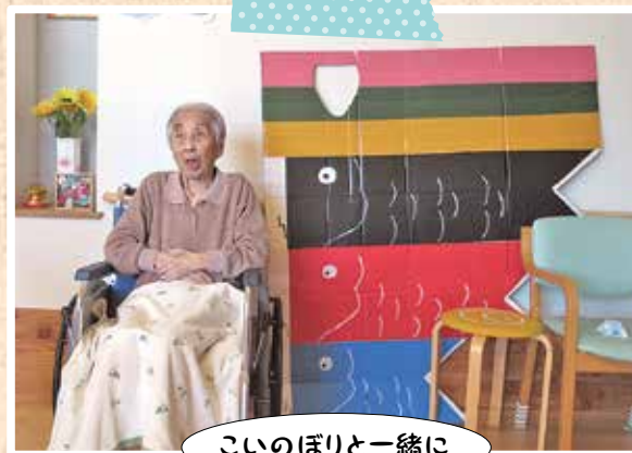
こいのぼりと一緒に