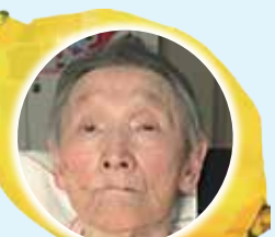
仁昌寺ハルノさん [昭和9年4月5日 86歳]