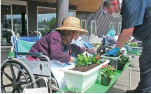
しっかり土をかけて～