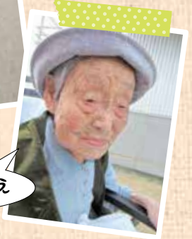
風が気持ちいいねえ