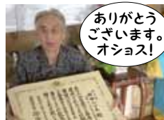
ありがとうございます。オショス!