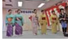
歌や踊りは私たちに任せて下さい!!