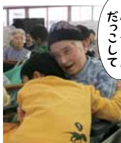
バーちゃんだっこして

今年も招待を受け、6名の利用者が参加しました。園児との合同競技「輝け!スター☆」は、星のリングをリレーし、ゴールのツリーに飾り付けていきます。もみじのような小さな手から渡されるリングを嬉しそうに受け取る利用者。ひ孫たちのほほえましい姿に元気をもらった一日でした。