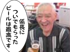
係長にツイてもらったビールは最高です