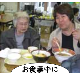
お食事中にすみません...

10月8日鶯鳴荘まつりを開催しました。「Enock」地域と共にをテーマに利用者の方々も展示やバザーの作品作りに、職員も準備に数か月前から取り組んでまいりました。 当日はあいにくの雨でしたが、ご家族や地域の方々の来場で賑わいました。日本赤十字社公式マス