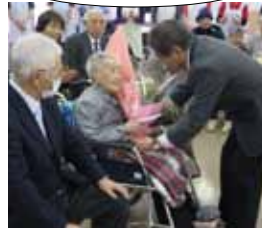
どうもありがとう