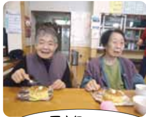
厚さ5cmの ふわふわのホットケーキ!

今年はずいぶん暖冬ですが、朝は気温が低く寒い日が続いています。寒さを吹き飛ばすように、デイサービスの年明けは、新年会を行いました。職員による余興は、「花笠音頭」「津軽甚句」の