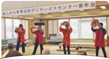
「花笠音頭」めでためでた～の♪

踊りや、カラオケを披露し、利用者の皆さん大変楽しまれました。2月の誕生会では、ふわふわのホットケーキを作り、お祝いをしました。今年も、さまざまなレク活動や、行事を予定していますので、体調に気を付けて元気にいらして下さいね。