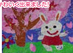
かわいく出来ました!

と好評でした。みなさんの表情を見ていたある職員が「何かに取り組む姿勢は何歳になっても大切なことなんですね。」と話していました。 余暇活動の時間も職員はいろいろと教わることの多い時間です。