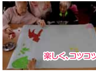
楽しく、コツコツと

こまの桜は4月中旬が見ごろですが、ひと足先に、かわいい桜が咲きました。 それは、3月末から4月にかけて余暇活動で作った桜のちぎり絵です。下絵は男性職員が書きました。知られざる特技？でしょうか。手本とそっくりの素敵なイラストが完成！皆さんが集まりちぎり絵に取り掛かると、手も口もよく動きます。和気あいあいと楽しい時間を過ごしました。今回のイラストは「ほのぼのして、良い絵だねえ。」