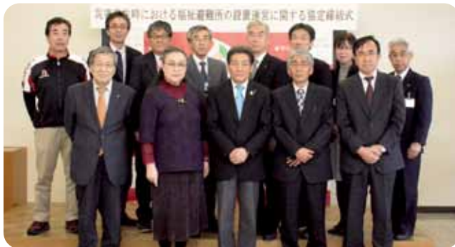
福祉避難所の設置締結式の様子

県内の災害では、平成11年以降の岩手山噴火の兆候、平成23年3月11日に発生した東日本大震災、平成25年8月9日の大雨洪水災害などをふまえ、栗石町では防災対策の見直しを随時行ってきました。また、福祉避難所については、当施設は、栗石町に昭和54年4月から設置運営して36年目となります。地域に信頼される施設を目指し、こつし