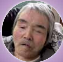
高八卦 正様 昭和7年5月10日 83歳