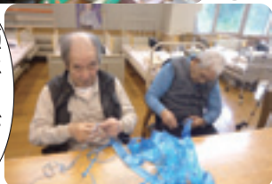
願いごとが 叶うといいなあ