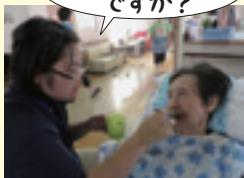
お茶おいしい ですか?

笑顔で利用者の食事や爪切り、髭剃りなどの介助を行いました。また、栗石町おすすめの温泉の話題で、利用者も会話を楽しんでいました。ご協力ありがとうございました。